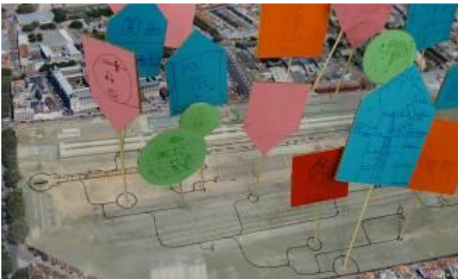
Trabajo participativo en Saint-Sauveur

El proyecto de barrio ecológico de Saint-Sauveur de Lille pretende actuar a escala local en el entorno físico, así como en los problemas sanitarios tanto físicos como psicológicos, asociados al entorno urbano. Este tipo de proyecto de ordenación permite promover un entorno de vida sano mediante la vigilancia de los riesgos para la salud (contaminación, ruido, alérgenos, materiales de construcción sanos, lugares de paseo y espacios públicos, necesidades de una población respecto al envejecimiento...). Por esta razón el proyecto del ayuntamiento de Lille en esta nueva ordenación tiene en cuenta los retos sanitarios, lo cual permite complementar la política medioambiental a favor de los habitantes de la ciudad y de las generaciones futuras.